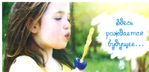
График работы центра: понедельник — пятница,